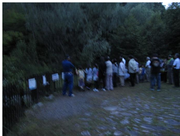
[日没後本格的にホタル観察]

勉強・見学会の翌日は再び前日同様の雨模様となり、開催当日は幸運でした。北神苑における工事は順調に進んでいるとの報告があり、カワニナの飼育・養殖など引き続き勉強会を重ねて、北神苑プロジェクトをぜひとも成功させたいと考えます。