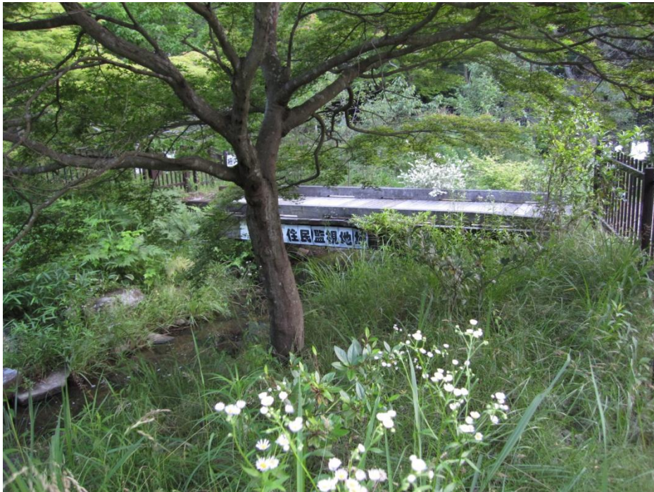
[ホタルの生息水路]