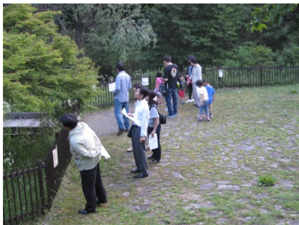
[日没前のホタル生息地で観察]

ホタルは予想どおり暗くなり始めた8時前から飛び始め、あたりが暗くなるにつれその数は増えてゆき、30匹ほど数えることができました。ホタル生息地では「初めて飛ぶホタルを見つけるのは誰か?」「2番目に飛ぶホタルを見つけるのは誰?」、そのような競い合いは参加した子供たちだけでなく大人にとっても大変良い思い出になりました。