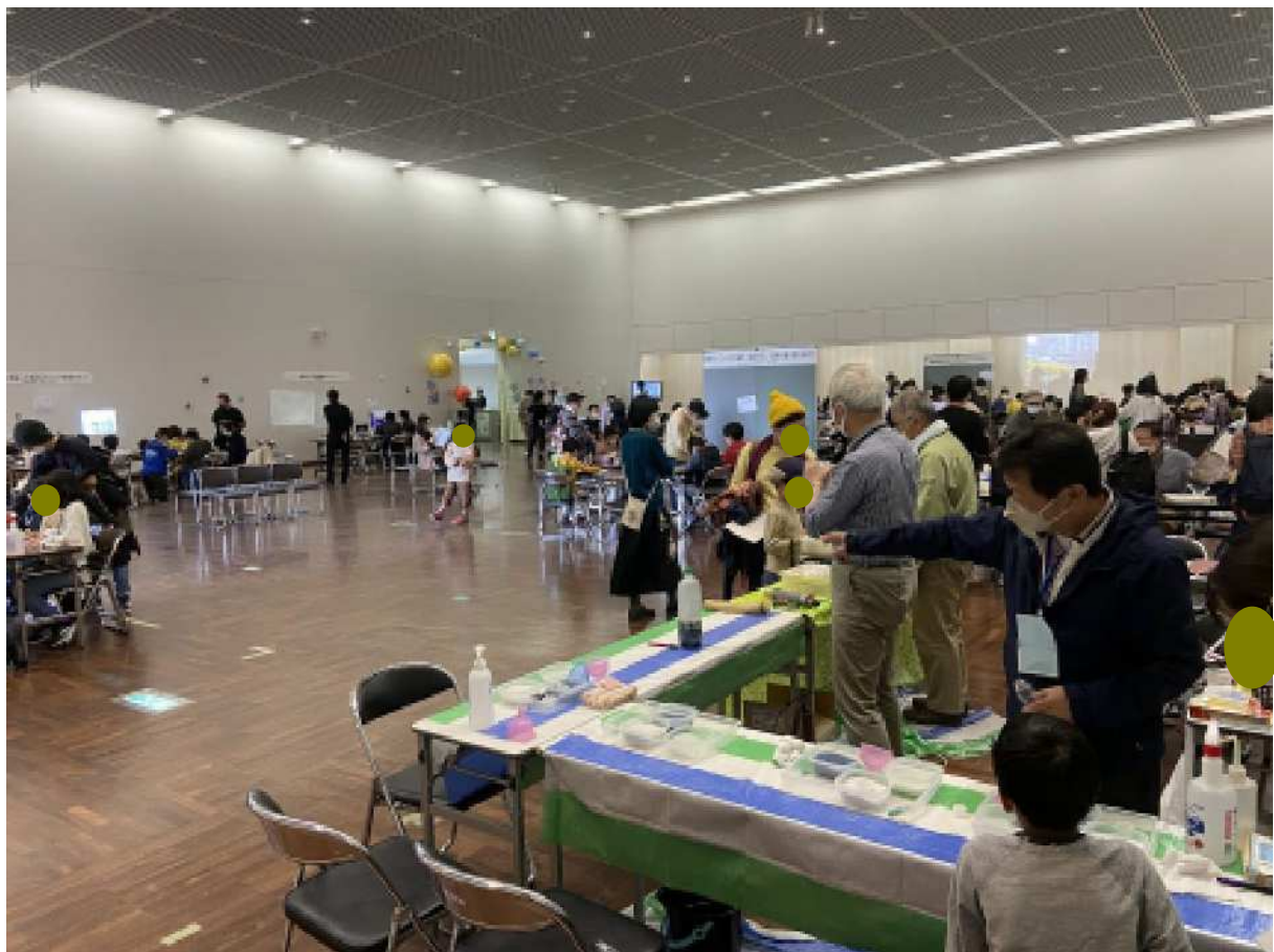
4_会場全体の状況です。ちょっとぼかして撮影しています。