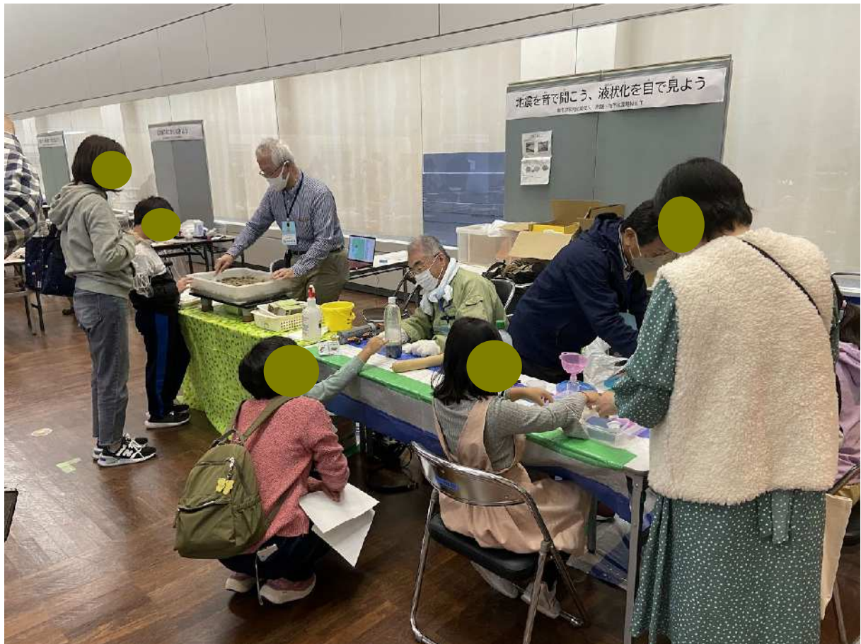
3_参加者が続々と集まって様々な実験を行っています。